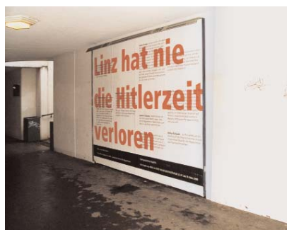
Graz, 2000, Foto / photo: Klub Zwei Linz, 2000, Foto / photo: MAIZ