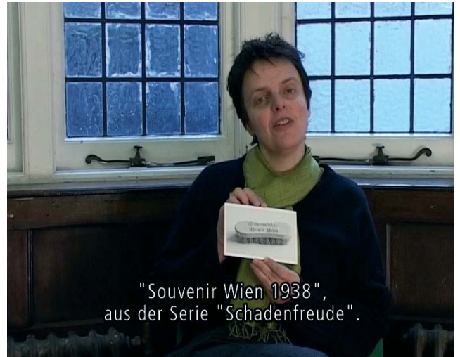
"Souvenir Wien 1938", aus der Serie "Schadenfreude".