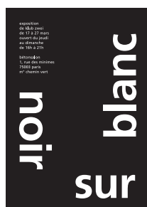
Einladungskarte / invitation card, Bétonsalon, Paris, 2005, Grafik / graphic design: Richard Ferkl

Not just the front side of photographs of destruction, which are often employed in a purely symbolic way, but the apparently innocuous reverse with its stamps and notes supposedly constitutes their place in the world, their historical context and therefore their significance, according to Klub Zwei's argumentation.