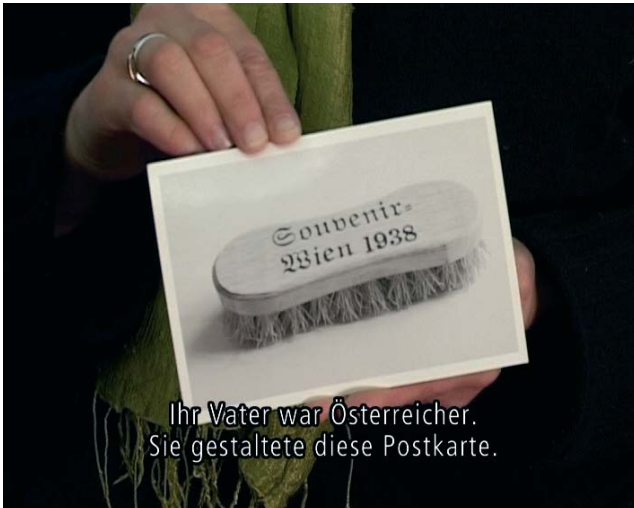
Ihr Vater war Österreicher. Sie gestaltete diese Postkarte.