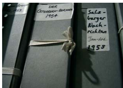
Ansicht / view Depot Institute of Contemporary History & Wiener Library, London, 2003