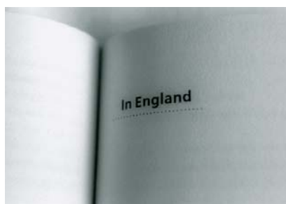
Fotoplots / photoplots, London, 2000, Fotos / photos: Klub Zwei