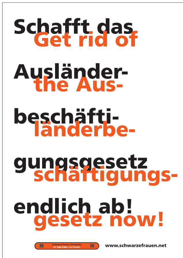
Arbeit an der Öffentlichkeit (Klub Zwei/SFC) 3 Plakate / posters, Wien / Vienna, 2005