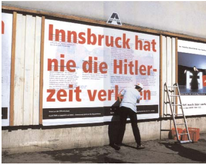
Innsbruck, 2000, Foto / photo: Klub Zwei

we proceed in this way we consider our deliberations to be a step in the direction of an ideal state of affairs, where collaborative work is based on equal participation.