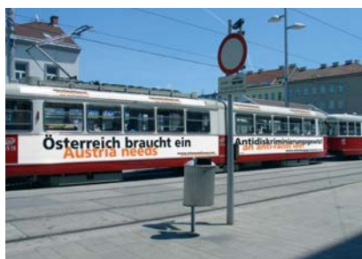
Arbeit an der Öffentlichkeit (Klub Zwei/SFC), Wien / Vienna, 2005, Fotomontage / photomontage: Petja Dimitrova