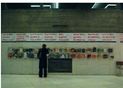
Installationsansicht / installation view, Thwarted Voices , Queen Elizabeth Hall, London, 2001

In der Zusammenarbeit und Auseinandersetzung mit Migrantinnen haben wir gelernt, dass wir als Staatsbürgerinnen an rassistischen Strukturen teilhaben. Unsere privilegierte gesellschaftliche Position steht kritisch zur