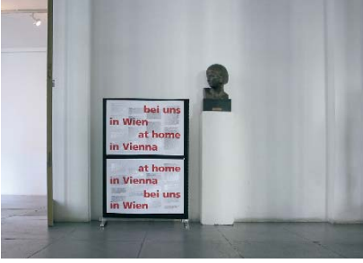
Installationsansicht / installation view, Bei uns in Wien / At Home in Vienna , Wittgensteinhaus, Wien / Vienna, 2003, Foto / photo: Rainer Egger

stehen. Things. Places. Years. fordert uns auf zu reflektieren, was diese Frauen – außer der Tatsache, dass sie mehr oder weniger zufällig ihr Zuhause in London fanden – gemeinsam haben. Das heißt, über die Bedeutung der Konstruktion von Identität nachzudenken: Was bedeutet es, wenn wir uns selbst definieren oder wenn wir von anderen definiert werden – als Frauen, JüdInnen, MigrantInnen, als TrägerInnen oder VerwalterInnen einer Kultur oder einer historischen Erfahrung?