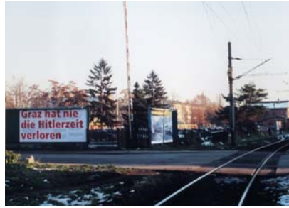
Links / left: Linz, 2000, Foto / photo: MAIZ Rechts / right: Graz, 1999, Foto / photo: Richard Ferkl

Diskussion. Denn genau diese Position ermöglicht weißen Staatsbürgerinnen die Ausübung künstlerischer oder wissenschaftlicher Berufe, während sie die Berufschancen von Migrantinnen mit gleicher Ausbildung und Qualifikation auf Jobs in Beratungsstellen reduziert. Vor diesem Hintergrund ist es problematisch, von „gleichberechtigter Zusammenarbeit“ zu sprechen. „Gleichberechtigung“ ist auch in Mikrostrukturen, wie unser Projekt eine ist, nach wie vor Utopie. Denn sie hängt nicht nur von Einzelpersonen, ihren Intentionen und Handlungen ab, sondern auch vom gesellschaftlichen Kontext, den Rechten und Positionen, die dieser zu- oder abspricht, und von den Effekten, die er auf Mikrostrukturen hat. „Gleichberechtigung“ ist so lange Utopie, solange eine gesellschaftliche und politische Rechte genießt, die der anderen verwehrt werden.