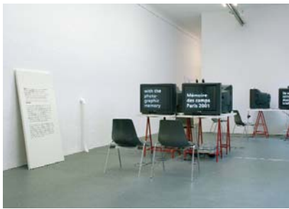
Installationsansicht / installation view, Nine points of the law , Neue Gesellschaft für Bildende Kunst, Berlin, 2004