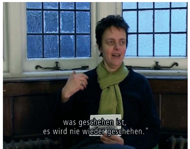
was geschehen ist, es wird nie wieder geschehen."