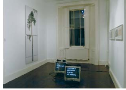
Installationsansicht / installation view, Voluntary Memory , London, 2004, Links / left: Klub Zwei, Ann-Sofi Sidén, Rechts / right: Ori Gersht, Klub Zwei, Ann-Sofi Sidén, Foto / photo: Anthony Auerbach

The use of photographs as icons often leads to their being nothing more than illustrations of authenticity. Black and White also persistently points to a prudent way of treating photographs as historical documents. Walter Benjamin was one of the voices to identify as a photograph's most important aspect its "label [...] without which all photographic construction must necessarily remain approximate." According to Benjamin, photographs provide something to read rather than see. Black and White conforms to this postulate.