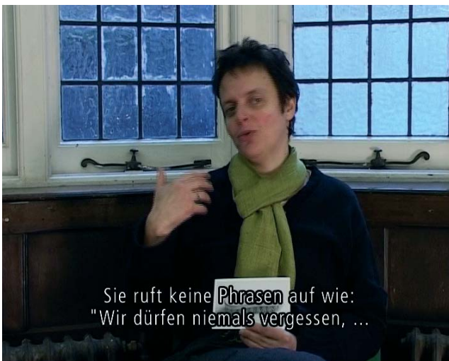
Sie ruft keine Phrasen auf wie: "Wir dürfen niemals vergessen, ..."