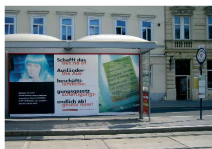
Wien / Vienna, 2005