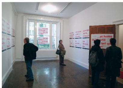
Installationsansichten / installation views, Bei uns in Wien / At Home in Vienna, Austrian Cultural Forum, London, 2001